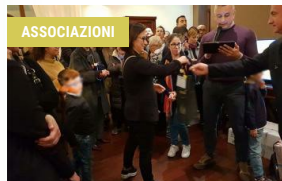
13 DICEMBRE 2018 L'Eccomi dell'Unitalsi