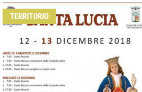
12 DICEMBRE 2018 I festeggiamenti in onore di Santa Lucia